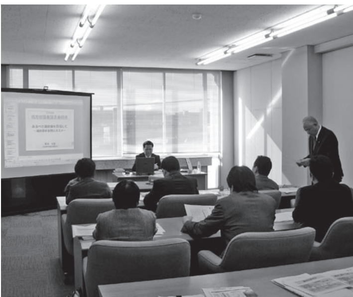
▲講師を招いて(1月23日)