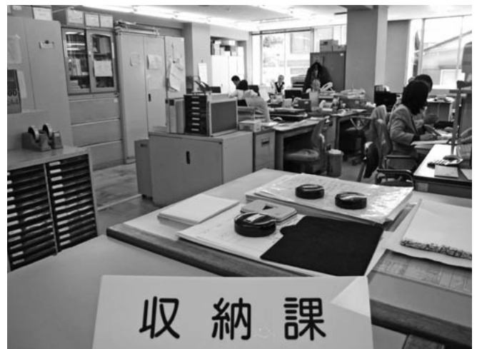
▲新設された収納課(役場1階下水道課東側)

活動をするなど、郷土愛を高める取り組みも行っています。今後もこれらの取り組みを継続的に推進し、新たな研修も実施するなど対応の改善に努め、職員の資質の向上を高めていきたいと考えています。