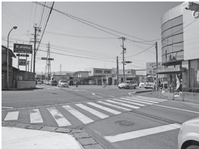
▲高屋太子3丁目交差点