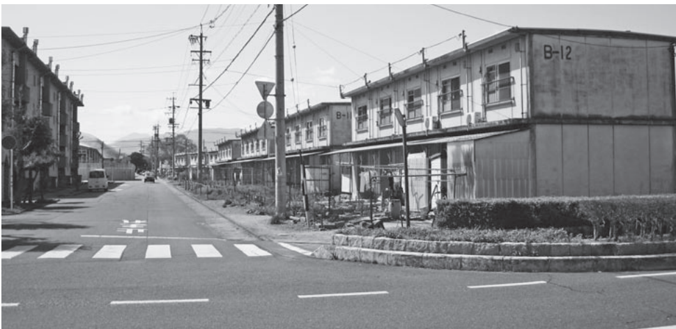
▲バスターミナルに整備される県営北方住宅B棟